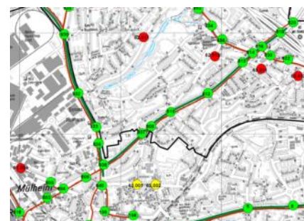
Übersicht der LSA auf der Aktienstraße